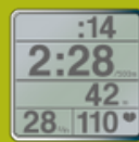
Büyük Veri Ekranı