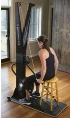
Zemin Stant Ölçüsü (Skierg Dahil):

Klasik (ayrı ayrı kollar) çekiş imkanı da mevcuttur. Bütün vücudu efektif olarak ritmik bir hareketle çalıştırır. Hem kuvvet hem dayanıklılık kazandırır. Eklemle zararı vermeden, yüksek kalori yakan bir egzersiz vadeder. Tüm yaş ve yetenek grupları için uygundur. Sakatlık yaşayan kişiler, oturarak veya diz çökerek harekete bacak katılım miktarını azaltarak, normal yoğunlukta ve sürede üst vücut ve merkez kaslarını çalıştırır.